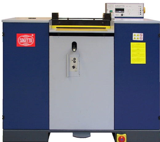
SPL 443 A