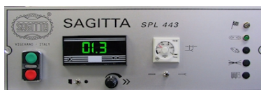
SPL 443 A Control Panel

Machine dimensions cm. 140 x 105 x 120 h. Machine weight Kg. 530