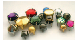
Borchie a griffa Nailheads