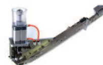
Caricatore di ricambio per borchie Spare Nailheads feeder