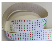
Cintura con borchie colorate Belt with coloured nailheads