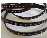
Striscia in continuo Continuous stripes