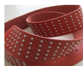
Cintura con borchia Belt with nailheads